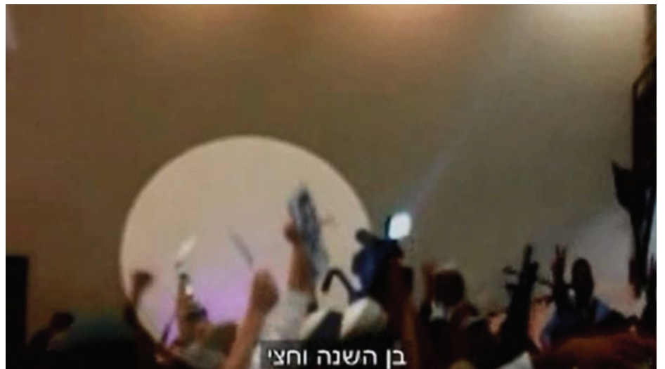
בן השנה וחצי

דער איזראעלי אמבאסאדער אין וואשינגטאן האט ערקלערט זיין שריט אז ער וויל דערמיט שיקן א מעסעזש צו די באוועגונג פון "די.בי.עס." וועלכע טוט ביאקטן פראדוקטן וואס קומט פון די שטחים, אז איזראעל איז איינס און וועט ווייטער שטיצן די סעטלמענטס. אזוי ווי די פרעזשטפולע "רויטערס" האט געמאלדן די נייעס אונטערן קעפל "איזראעל'ס אמבאסאדער צו די פאראייניגטע שטאטן מאכט פאליטישע פוינט מיט שטחים ערצייגטע געשאנקן". די גאנצע וועלט שטייט און קוקט ווי די ביבי רעגירונג האט