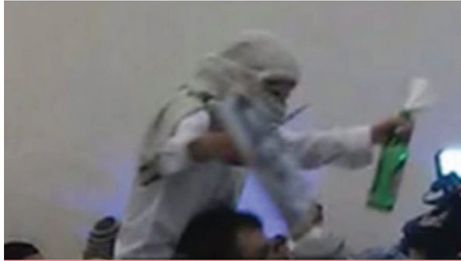
"וַיַּחַלְלוּ אֶת שֵׁם קִדְשֵׁי בְּאֵמֹר לָהֶם עִם ה' אֱלֹהֵי וּמֵאַרְצוֹ יֵצְאוּ"

לאזט זיך נישט זאגן וואס פארא טונקעלע אימעזש די עטליכע עקסטרעמע ראדיקאלן שמירן אן אויפ'ן גאנצן כלל. ומידינו יבוקש זאת, קיינער קען נישט פאראויסזאגן וויאזוי דאס קען עפעקטירן חרד'ישע אידן איבער די וועלט און אפילו אין אמעריקע חלילה, ה"י. דאס יהדות החרדית מוז שטיין אויף די אפענסיווע און נוצן די ריכטיגע מיטלען צו מודיע זיין פאר די וועלט דאס פארקערטע.