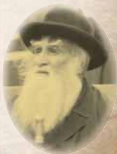
הגאון רבי יצחק ירוחם דיסקין זצוק"ל

מודעה שנתפרסמה בעת נסינות החינוך הטהור בעיה"ק ירושלם ת"ו, מאת מרן הגה"ק מרא דארעא ישראל רבי יוסף חיים זאנענפעלד זצ"ל ובית דינו, כאשר הימים דאז היו לאחר מלחמת העולם הראשונה ובירושלם סבלו חרפת רעב ל"ע, ובימים קשים אלו הגיעו הציונים עם אוצרותיהם ע"מ לכבוש את החינוך בידיהם. בני ירושלם ובראשם מרן זיע"א הכריזו לעומתם כי ברעב נגוע ואת חינוך בנינו לא נמסור בידם.