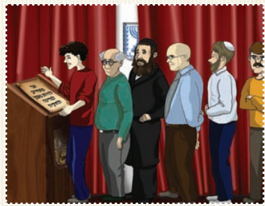
די פרייע, מזרחי, און די פרומע סטייגן אין איין רייק צו בחירות...

נאנט צו א מיליאן אידן אין ארץ ישראל זענען שומרי תורה ומצוות חסידישע און ליטווישע אזוי ווי אונז, זיי זענען קאנצענטרירט אין דריי פארטייען, שס - ספרדי'שע אידן. דגל התורה - ליטווישע אידן. אגודה - חסידישע אידן.