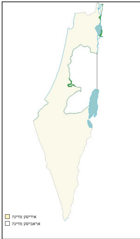
די מדינה נאך די מלחמה תש"ט - אסאך גרעסער ווי די יו. ען. רעקאמאנדאציע 78%