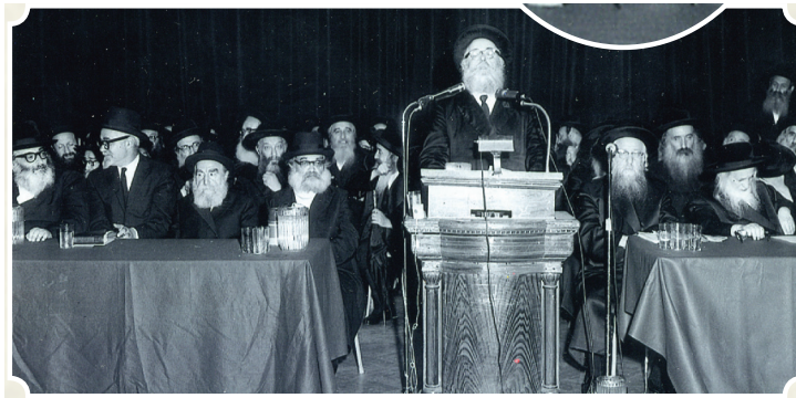
גרויסע פראטעסטן אין אמעריקא, אפצושאפן די גזירות