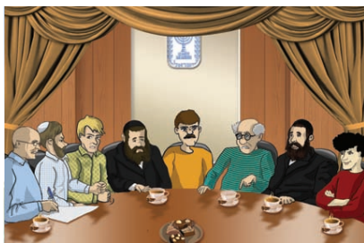
ציניק 13 מאי 1948 אין די כנסת הימים.

מיר זעהן ווי ווייט די צדיקים האבן מורא געהאט פון די אגודה. אז ווען די אגודה האט דאן איינגעפירט צו לערנען יעדן טאג א בלאט גמרא אונטער א פראגראם 'דף היומי' האבן די רבנים וואס זענען געווען קעגן די אגודה, גע'אסר'ט דאס צו לערנען ווייל זיי האבן געזעהן א סכנה צו געהערן אויף סיי וועלכן אופן צו די אגודה. עס האט זיך טאקע ארויסגעשטעלט אז דאס וואס די צדיקים האבן פאראויס געזעהן האט ליידער פאסירט. די אגודה האט זיך מער און מער דערנענטערט צו די ציונים. ווען די מדינה איז געווארן א מדינה האבן די פירער פון די אגודה געזאגט לאמיר אריינגיין אין די רעגירונג, אזוי וועלן מיר קענען אויפטוהן פון אינעווייניג, פאר אידישקייט. זיי האבן דאן אויסגעארבעט א כלומר'שטען היתר אריינצוגיין און זיצן מיט די אפיקורסים אין די כנסת המינים. דאס זעלבע האבן זיי מתיר געווען צו גיין וועלן (vote'n) א פארשטייער פאר די רעגירונג.