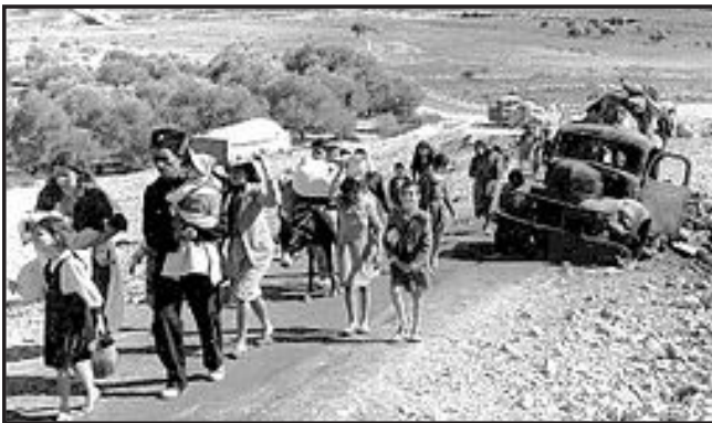
די ציונים פארשיקן די אראבער פון זייערע וואוינערטער

ארץ ישראל האט אין די יארן פאר זי איז געווארן מדינת ישראל, געהייסן פאלעסטינע. די באפעלקערונג אין די דעמאלטס'דיגע פאלעסטינע איז געווען א געמיש פון אידן און פון אראבער. ווען די ציונים האבן מיט געוואלד, מיט טעראר, און מיט ווילדע שטיקעס פארטריבן די ענגעלדער וואס האבן דאן געהערשט אויף פאלעסטינע. האט די יו.ען. צוטיילט דאס לאנד פאלעסטינע אין צוויי. 55% פון די לאנד האבן זיי געגעבן פאר די ציונים, און 45% פון די לאנד פאר די פאלעסטינער אראבער. טאקע דארט אין יענע שטעט ווי די אראבער זענען געווען קאנצענטרירט. און ירושלים וועט