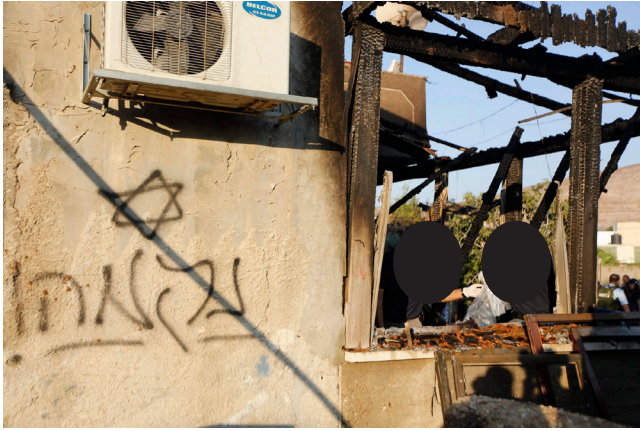
די הויז וואס די מתנחלים האבן פארברענט

די יעצטיגע אינטיפאדא אויפשטאנד האט אויפגעפלאקערט ענדע זומער ווען א באנדע רעליגיעזע בריונים האבן אוטערגעצינדן א הויז פון א פאלעסטינע משפחה אויפן מערב ברעג און האבן פארברענט א פאלעסטינער קינד און זיינע ביידע עלטערן. די ציוניסטישע בריונים האבן ארויפגעלייגט זייער זיגל אויפן הויז מיט שרייבן "נקמה" און "משיח" כאילו זיי זענען די ארמיי פון משיח. אין די צייט וואס זיי ברענגען די חבלי משיח.