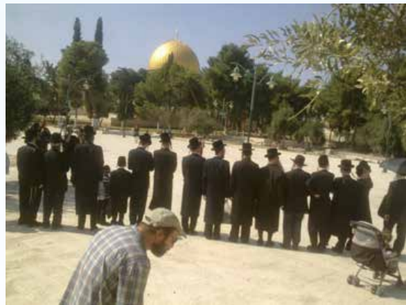
ווער ברענגט אלע שלעכטס? די בילדער פון חרדיש'ע אויסזעהן וואס גייען ארויף אויפן הר הבית און זיי ערוועקן די צארן פון די אראבער