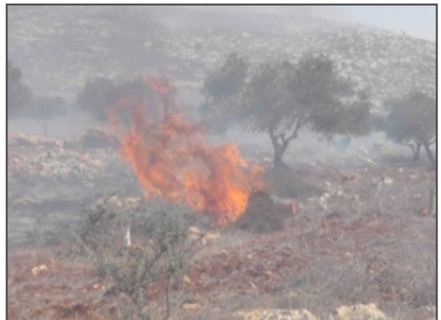
די מתנחלים פארברענען זיתים ביימער