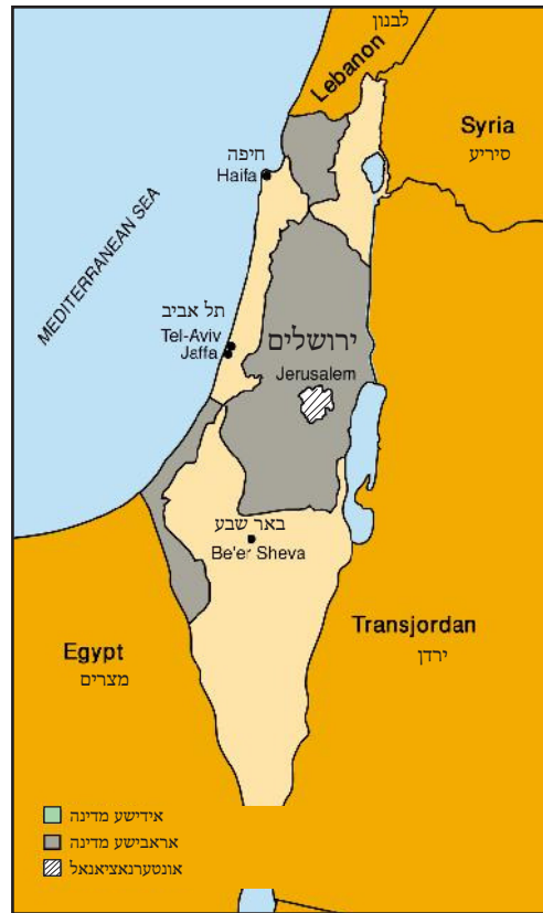
די יו. ען. צעטיילונג פלאן 55% אידישע מדינה 45% אראבישע מדינה