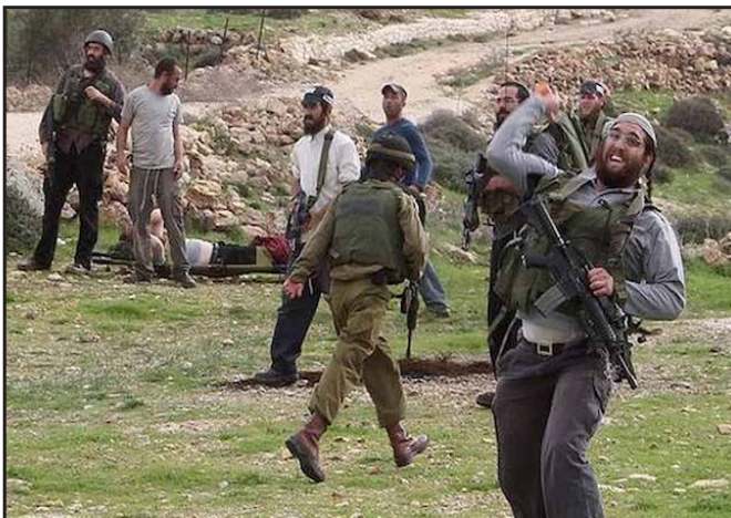
די מתנחלים מיט די בארד און פיאות ביי זייער ארבעט - די מעשה רדיפה אויף כלל ישראל ר"ל

ליידער זענען טייל פון די מתנחלים מיט בארד און פיאות, און זיי מיינען אז זיי טוען גאר א מצוה ל"ע, און דאס ברענגט אז די אראבער זענען ספעציעל בכעס אויף די פרומע אידן מיט בארד און פיאות, און זיי זוכן דווקא צו אטאקירן פרומע אידן ה"י.