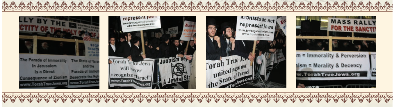
פראטעסטן אראנזשירט דורך נטראן

פון ערליכע אידן. אז ערליכע אידן ווילן זיך נישט רייצן מיט די אראבער, ווייל די תורה ערלויבט דאס נישט אזוי ארום האפט מען אז די אראבער וועלן זעהן אז נישט אלע פרומע אידן ווילן זיי פארטיליגן, אפשר וועט עס עטוואס פארמינערן די געוואלדאטן קעגן פרומע אידן.