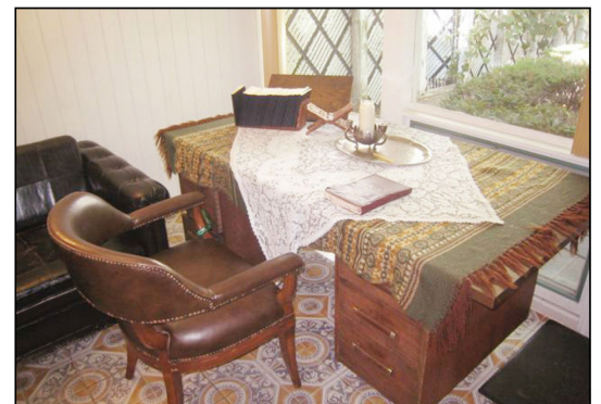
דאס רבי'נס קוויטל שטוב אין קרית יואל פון וואו דער רבי האט באשליסן די אויגן פון כ"א כסלו תשע"ו

אז ווער עס האלט ח"ו ווי די ציונים אז עס מעג זיין א אידישע מדינה