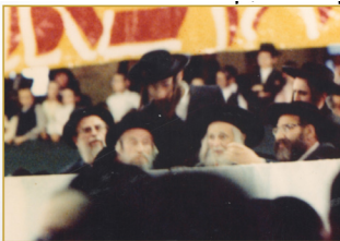
רבינו הק' ביים גרינדן די אוסד קרן הצלה יאר תש"ח

ריזיגע געלטער, און די נסיון פון די ערליכע מוסדות איז געווען זייער גרויס. קרן הצלה פארטיילט געלטער פאר די ערליכע מוסדות וואס נעמען נישט קיין געלט פון די מדינה. דער רבי האט דאן געזאגט פייערדיגע ווערטער "ווער עס וועט העלפן פאר די מוסדות וועט משיח ווייזן מיט די פינגער אז די אידן האבן מקרב געווען די גאולה שלימה."