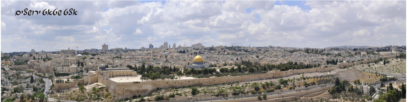
אלט שטאט ירושלים

אין יאר תשכ"ז איז פארגעקומען די 'זעקס טאג' מלחמה' ווען די ציונים האבן מיט א בליץ - קריג קעגן די אראבער געווינען די אראבער און זיי האבן באקומען אין זייער באזיץ די כותל , די הייליגע מערב וואנט פון די מויער פון די הר הבית. הר הזיתים - די בארג וואו עס ליגן באערדיגט אלע קדושים פון הונדערטער יארן פריער. אלט שטאט ירושלים - די אור אלטע שטאט ירושלים. די שמחה ביי די מאסן איז געווען זייער גרויס, מען האט געטאנצט אין די גאסן.