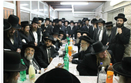
ערב תג הסוכות תשע"ה לפ"ק גבורי סח די מנהלי המוסדות באר"ק שעפן זיך אן מיט געוואלדיגע חיזוק ביי די גרויסאויטגע חלוקה געלט שטיצע-פאר אלע מלמדים ומרביצי תורה לכבוד חג הבע"ט