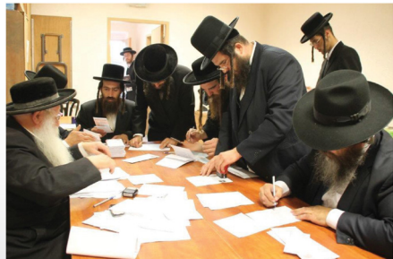
מנהלי המוסדות שרייבן אונטער די שטרי תמיכה פון קרן הצלה חודש תמוז תשע"ד לפ"ק -