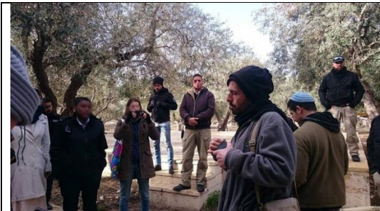
בחורה חילונית מצלמת ב'טיול קבוצתי', ובנוסף שוטרת משגיחה על כך שלא יפריעו ל'סיור מסורת'

ולצורך ביאור עניין זה אביא תמונות מתוך האתרים, שפורסמו בפייסבוק, של אותם מטיילים