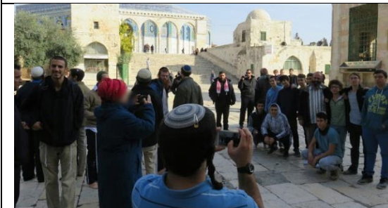
עוד צילום קבוצתי בסיור 'של הכרת הארץ', עם ערבוביה של נשים וגברים, וג"כ ספק תפילה מתישהו!! וכן הלבוש הנהוג של המטיילים ברחבי הארץ ע"מ לכבד את מקום מקדשנו שימו לב שישנו אפילו מוסלמי ברקע שמסתכל בכעס על כל הנעשה.