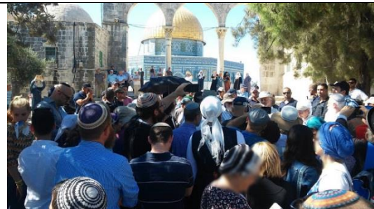
דוגמא לכך שאינם מתקנים תיקון גדול אלא מקלקלים קלקול גדול